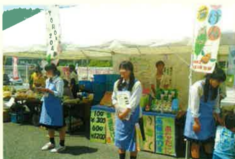
「ちょっと心配になって…」昨年販売した先輩も思わず様子を見に来てくれました。後輩の活躍を応援してくださいね。

今年のビジネス実習生は、今回の販売が初めて。石けんを販売するために、今年も工夫してきました。のぼりや、POP、販売価格やセツト名などを考えてきました。泡立てておいた石けんを手につけてもらって、感触を感じていただく手法は伝統的に引き継がれています。この日も小さなお子さんに、泡をさわってもらって手洗いを一緒にします。「ふわふわ」「すーい」子供たちが楽しそうに手洗いを体験しています。「きれいになったね♪」お姉さんがニコニコしていると子供たちも楽しそうで、つつい親御さんの財布のひもも緩む感じ。 (さすが！)