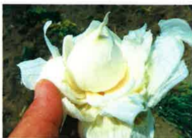
全部剥がしてみたら、こんなになってました。これはアタリ♪にんにくらしき玉が出てきました。でも、割れていないにんにくなんて…？