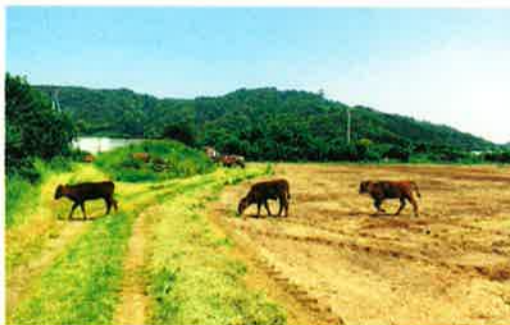
にらみ合いに負けて、すごすごと牛舎に向かう三頭（笑）向かってこられたら、怖いサイズです。

それは冗談。農場の隣にある牛舎から抜け出して、農場の中を闊歩しているらしいのです。それにしても器用に…今は、にんにくも収穫した後なので良いのですが、まさかケールを育てている時に糞を落とされる危険性があるということ？