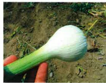
一つ玉のにんにくは、収穫されません。ちょっと中を見てみましょう。