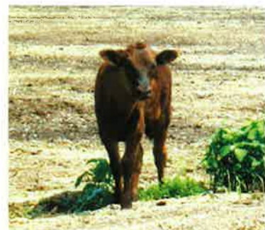
暑い視線を飛ばしてきた牛さん。しばらく見つめあってました。

農場を取材しに、ちょうど9番の圃場に向かって歩いていたら、何やら視線を感じるので、ふとその方向を見てみると…その先に牛（汗）