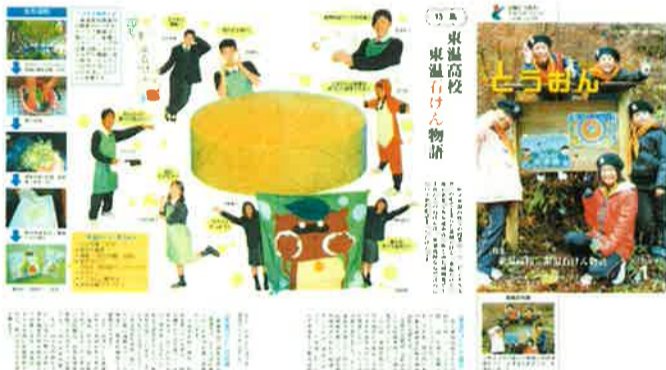
2013年1月号の東温市広報にも、「東温石けん物語」として紹介されました。販売のツールはすべて手作り。毎年、アプローチが違います。今年も、販売戦略やマーケティングにと、経験を積んでいきたいと思っています。

このクヌギの葉は年に一度五月に、虫食いの無いきれいな葉を商業科の生徒が協力して収集します。昨年より成分に放射性物質の吸着・除去する働きがあるゼオライトを、毛穴の掃除成分として採用しています。