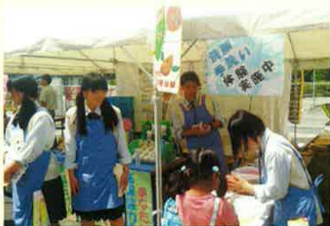
制服にエプロン。男子よりも女子の方が前に立って声を出す率が高い。男の子はおとなしいのかな。