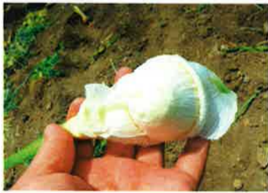
外側からどんどん剥がしてみるのですが、しわしわな皮状態が続きます。中はどうなってるの？

ボール状になった一玉のにんにく？っぽいものは出てきましたが、他のものを剥いてみると全然中身がないものさえありました。こうしたら割れないにんにくは、にんにくの芽も育たないそうです。なぜ、出来てしまうのか？種なのか育て方なのか？品質の良い、おいしいにんにくを育てるために頑張ります。