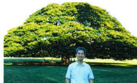
ハワイの販売に出張した際には、あまり外を歩くことができず、練習不足に。有名な「この木なんの木」の前で記念に！

最初は怖かったのですが、途中から思いきってランへ。海外で走る怖さより、練習の空白が怖かったそうです。一生懸命なんです。ちよつと、やりすぎ？