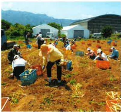
5月22日、丹原の圃場で、にんにくの掘り取りがはじまりました。日差しの強い日でしたが、みなさん頑張ってにんにくをキャリーに集めています。

授業では商品開発も行われ、今や東温高校ブランドとなった「東温石けん」もビジネス実習で生まれました。一期生は、わずか二名。「東温高校のシンボリック存在であるクヌギの葉を使用した」二人の熱い想いを受け、遠赤青汁の石けん加工技術を使い、クヌギの葉と海塩(伯方の塩)を使った「東温(とうおん)石けん」が誕生しました。クヌギの葉には抗酸化、抗炎症効果が期待できるカテキンが豊富です。