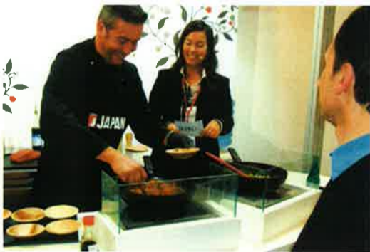
現地のシェフに黒にんにくを使った料理をその場で調理するデモンストレーションも行いました。早速、お客様にご試食していただきました。

ドイツ・ニュルンベルクで二〇一四年二月十二日から十五日まで開催された、世界最大のオーガニック専門見本市 BioFach（ピオファ）2014。遠赤青汁は、JETRO（日本貿易振興機構）主催のジャパン・パビリオンに出展参加しました。EU諸国で初の営業活動です。