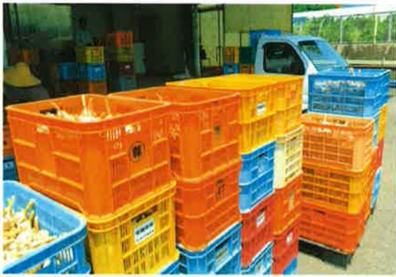
収穫されたにんにくは、乾燥して保存します。キャリーと呼ばれる専用の箱に詰められています。乾燥を終えると、根の部分と茎の長さをカットしていきます。