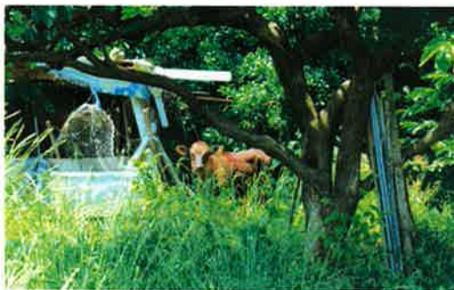
もう帰ったかな？と木陰から様子をうかがう牛さん。私が帰っても、農場に入ってきてちゃだめ！