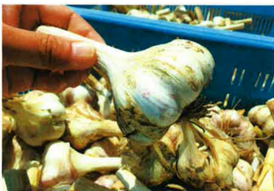
カットされたにんにくは、サイズごとに分けられて保存します。この時に、割れていないか、色は悪くないかなどチェックしていきます。