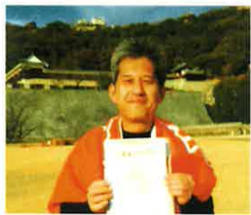
完走しました！次回は、歩かずに全部走りきります。（松山城をバックに賢う）