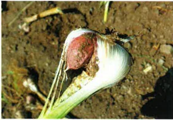
収穫されたにんにくの中には、すでに形が割れてしまっているものもあります。きれいに玉になっていないものは、バラバラにして使います。

土づくり、人づくり。農場の作業は素材によってさまざまですが、工夫をしながら、より良い品質のものを育てています。今年もおいしいにんにくが育ちました。皆様に、お届けします。