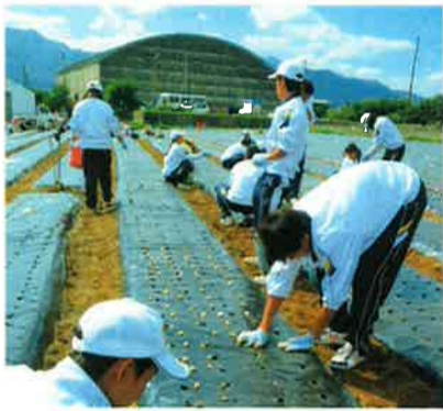
2013年10月12日に、にんにくの種となる1片を植えました。今年の掘り取りに来てくれた生徒さんもいたのかな？